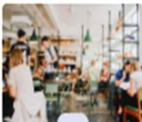
Figura 8. Sentir de los estudiantes