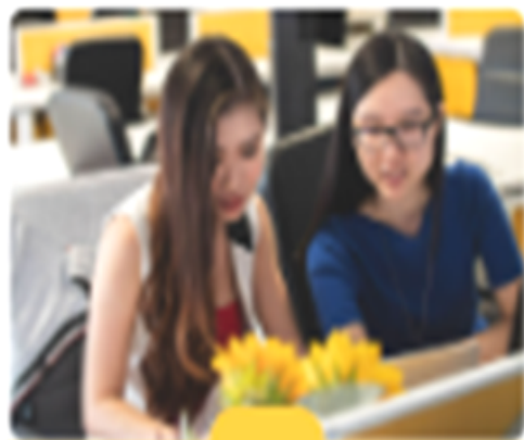
Figura 13. Acciones para implementar por los estudiantes