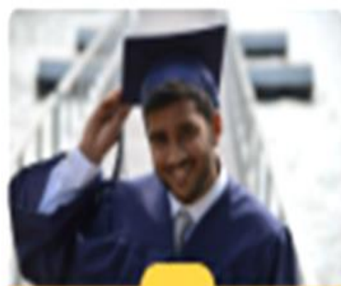
Figura 3. Infraestructura personal