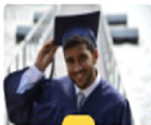
Figura 12. Promedio estudiantil