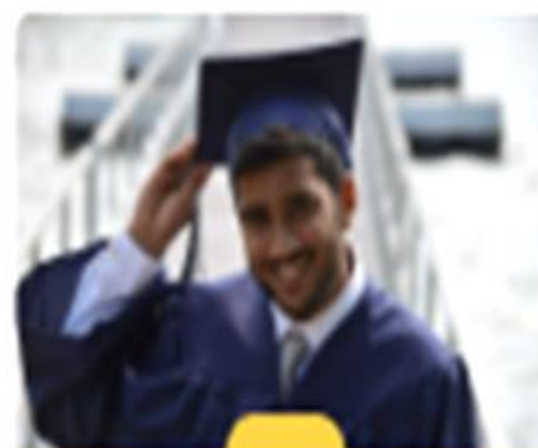
Figura 6. Medio electrónico de comunicación docente