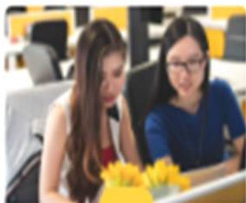
Figura 10. Actividades de los estudiantes además del trabajo en clase