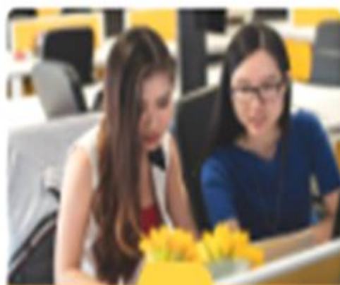
Figura 1. Confinamiento

Desde la gráfica número 1 hasta la número 14.