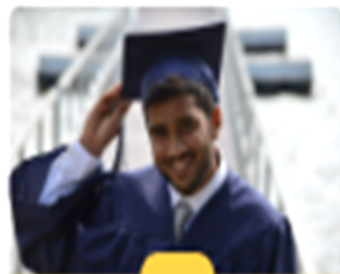
Figura 14. Acciones para implementar por los docentes