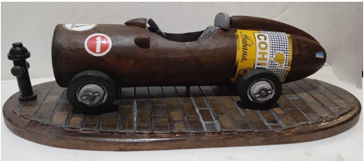
Prototipo No.1 "MARTÍN MÓVIL" por "JUGUETES LAU"